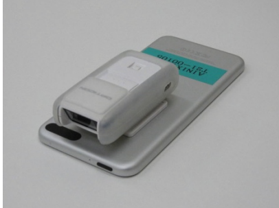
ポケットスキャナ