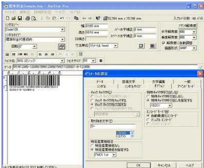
料金代理収納バーコードの作成例