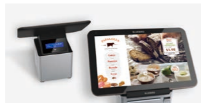
プリンタを一体化したモデルPT100 (PT101)