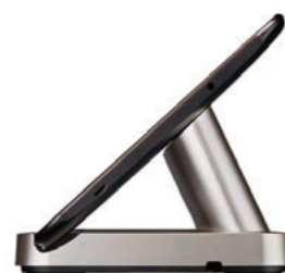
マルチポートのクレードル