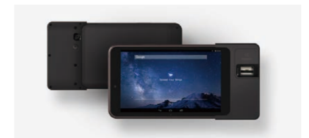
スマートプラグ タイプ1 (指紋認証)