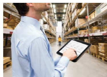
持ち運びが容易な軽量デザイン