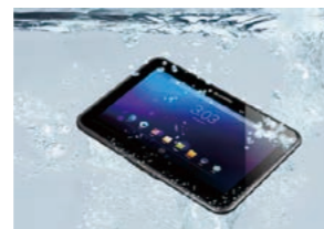
防塵・防水グレードIP65