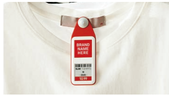
ファッションラベル

SoluM社は、2015年にサムスン電機から電力モジュール、ICT、ESLの3事業を引き継ぎグローバルに展開しています。ESL事業は、世界トップクラスの出荷数で、今まで35カ国、8,000ストア、1億個の導入実績を持っています。また、1.6インチから11.8インチまでの豊富なサイズ、標準装備されたLEDとボタン、そして、ファッションラベル、シューズラベル、フリーザラベルなど豊富な品揃えが特長です。また、ベトナムと中国に自社工場を持っていますので、フレキシブルにしかも安定的に製品を供給できます。