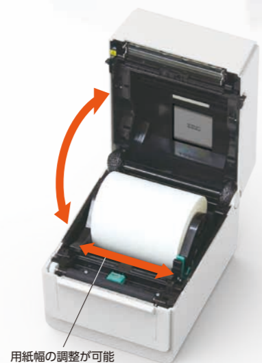
用紙幅の調整が可能

コネクタが外に出ないコンパクト設計 プリンタ背面のケーブルコネクタ部を一段奥 に設置しているため、ケーブルコネクタ部の 筐体外への露出を抑制。後方が狭い置き場でも 安心です。