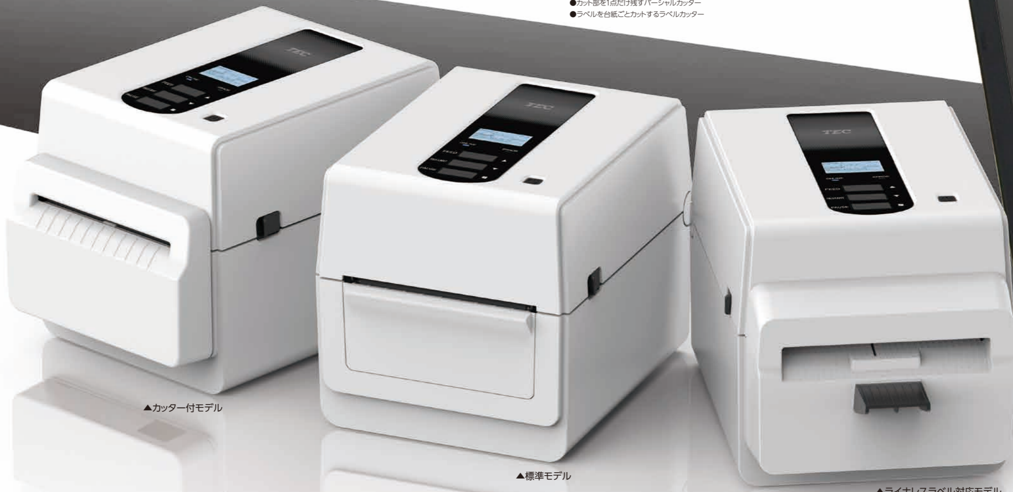
▲カッター付モデル