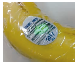
円形スポット照準光