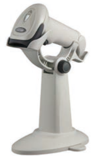
ハンドフリースタンド

⚠ 安全に関するご注意 ご使用前に取扱説明書をよくお読みの上、正しくお使いください