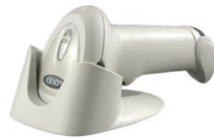
ユニバーサルホルダ